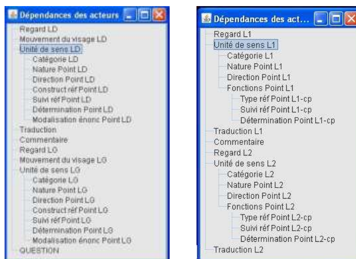
Figure 2 : Représentations du schéma d'annotation intermédiaire (partie gauche) et du schéma d'annotation final (partie droite)

On peut considérer, a posteriori , que le schéma d'annotation a subi trois étapes majeures d'évolution avant d'apparaître dans sa version actuelle. Les changements ont concerné avant tout les pistes relatives aux pointages.