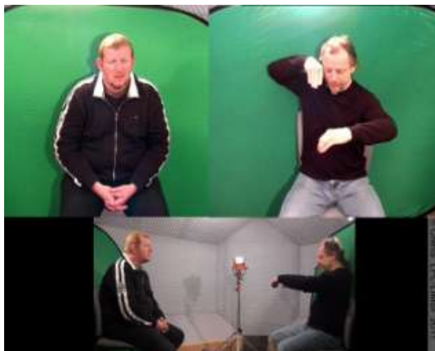
Figure 3 : Arrêt sur image de l'unité « avant la descente », 00 :18.800, (locuteur 2, à droite)

Au final, l'annotation proposée mêle deux niveaux, correspondant à deux objectifs, nécessaires à l'analyse visée :